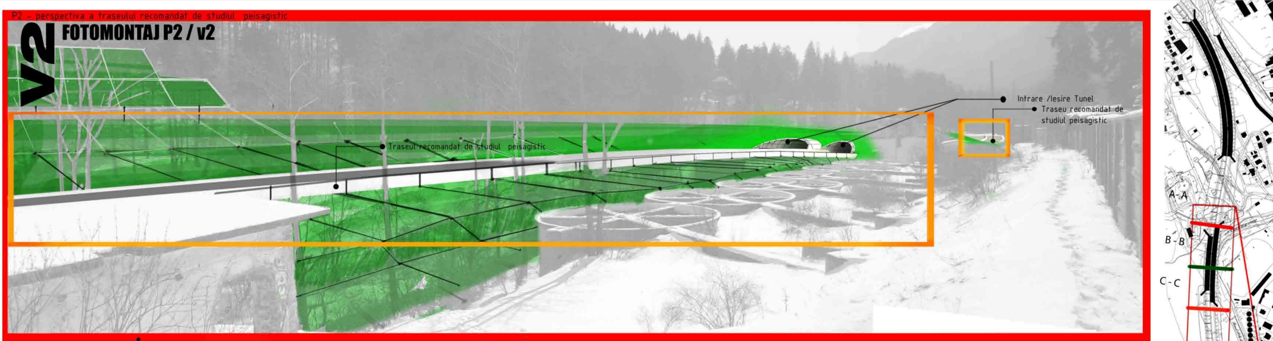
V2 FOTOMONTAJ P2 / v2 P2 - perspectiva a traseului recomandat de studiul peisagistic