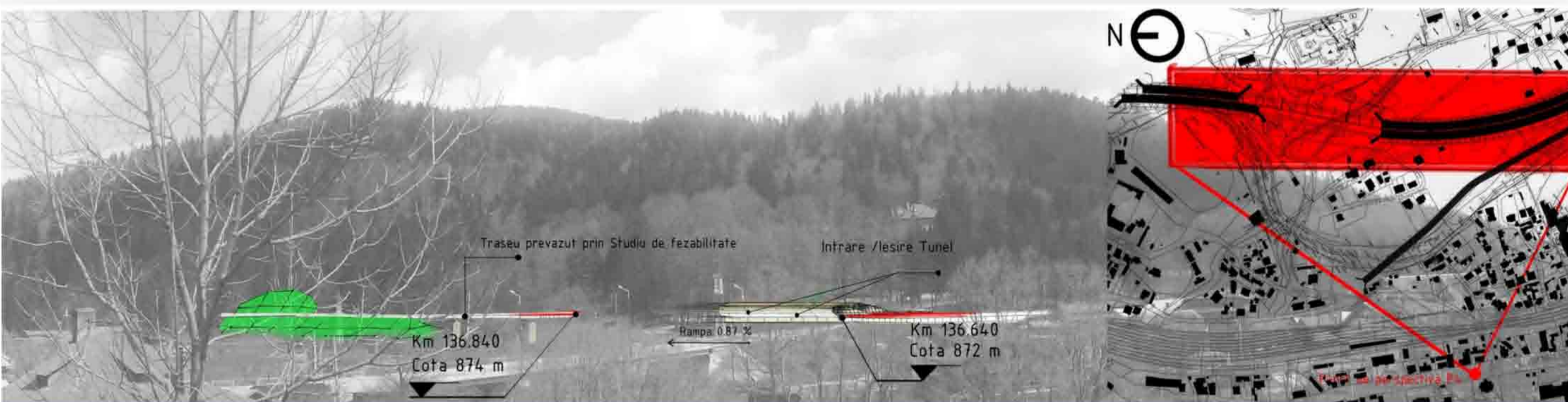
P4 - perspectiva a traseului propus prin Studiul de Fezabilitate